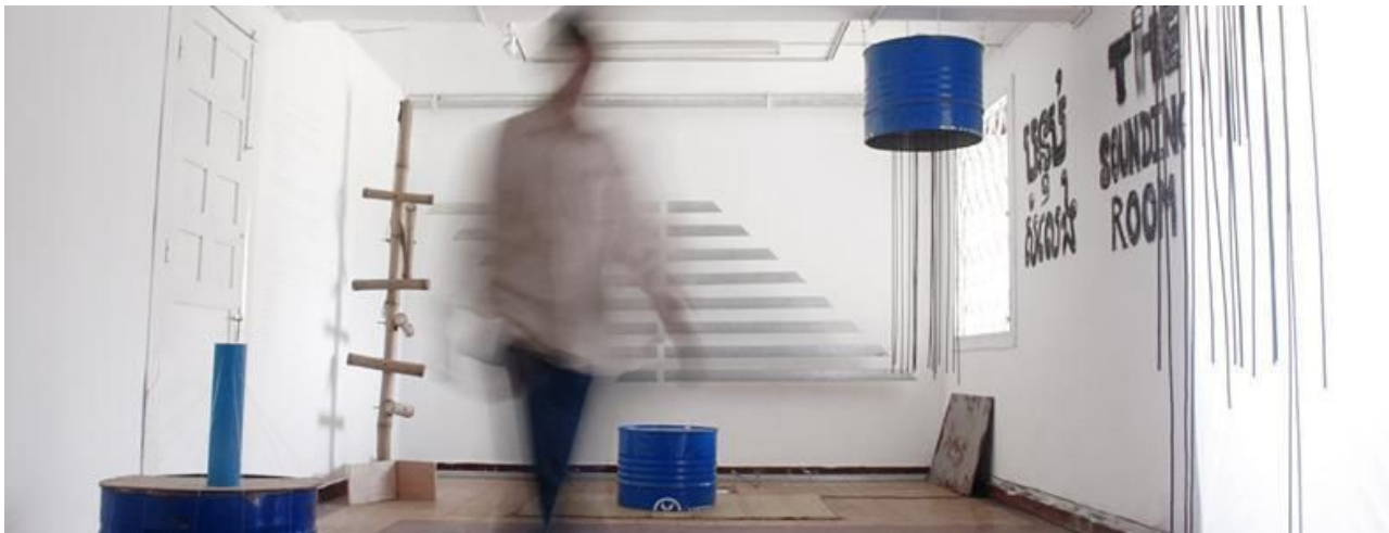
Sa Sa Art Projects, Cambodia

[Revised on 26 Sep 2017] Marked as red below