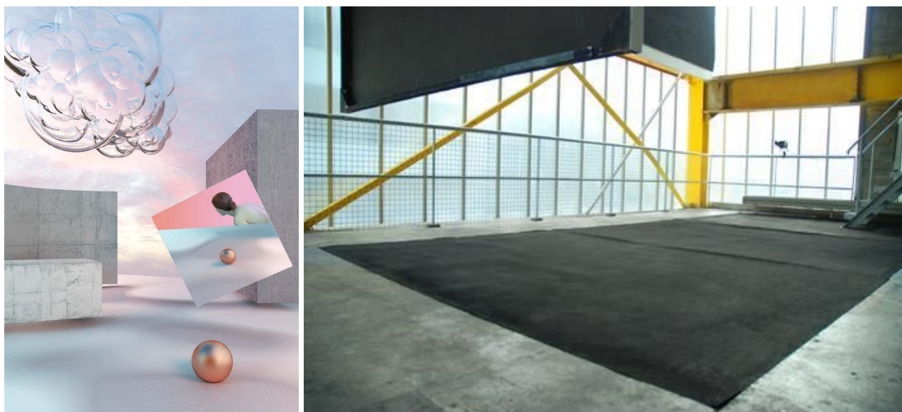
Le Lieu Unique, France